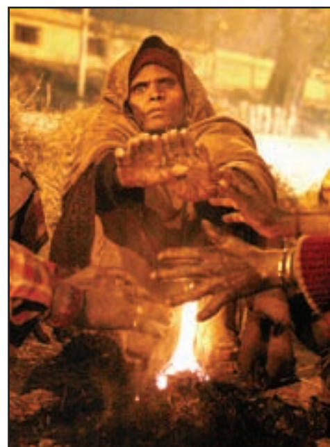
Imigrantenan ta trahado sin cas, ta keinta nan mes na un candela banda di un caminda na New Dehli, India. Diadomingo. Miyones di e persona den e capital di India a lanta diadomingo cu e clima mas friu den 70 aña, mientras cu e cantidad di morto a aumenta na 116, segun e bocero di polis y di e departamento di Meteorologo.